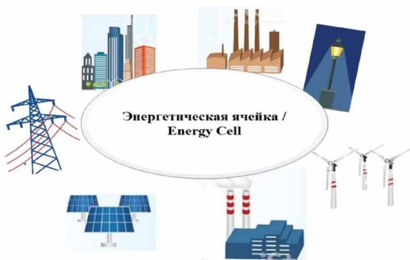
Рисунок 3. Энергетическая ячейка — объект распределенной энергетики Figure 3. Energy Cell is a distributed energy facility

Создание таких систем целесообразно в энергорайонах с локальным дефицитом электрической и тепловой мощности, что сдерживает строительство жилья ограничением доступности технологического присоединения новых потребителей. Коммунальные энергетические ячейки способны работать автономно, а их интеграция с региональными системами электроснабжения существенно повышает надежность электроснабжения. Согласно выполненным исследованиям, снижение показателей бесперебойности электроснабжения